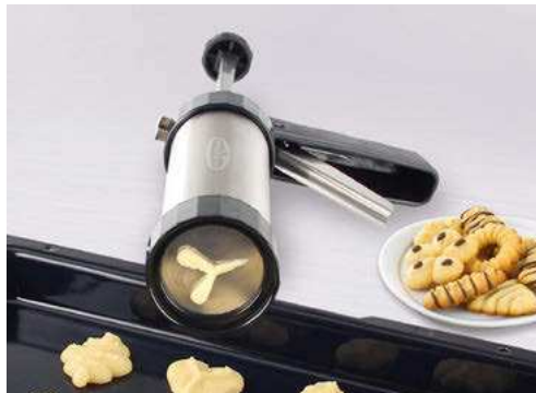
Seite 8 - 9 Plätzchen-Helfer