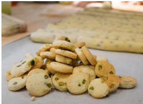
Seite 3 - 7 Plätzchenrezepte