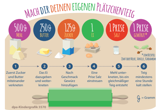
Seite 16 Kinderseite