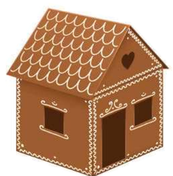
Seite 10 - 11 Lebkuchenhaus-Anleitung