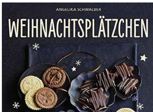
Seite 14 - 15 Backbücher