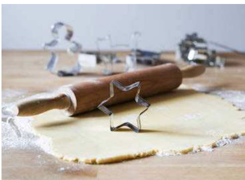
Seite 12 - 13 10 Profi-Tipps